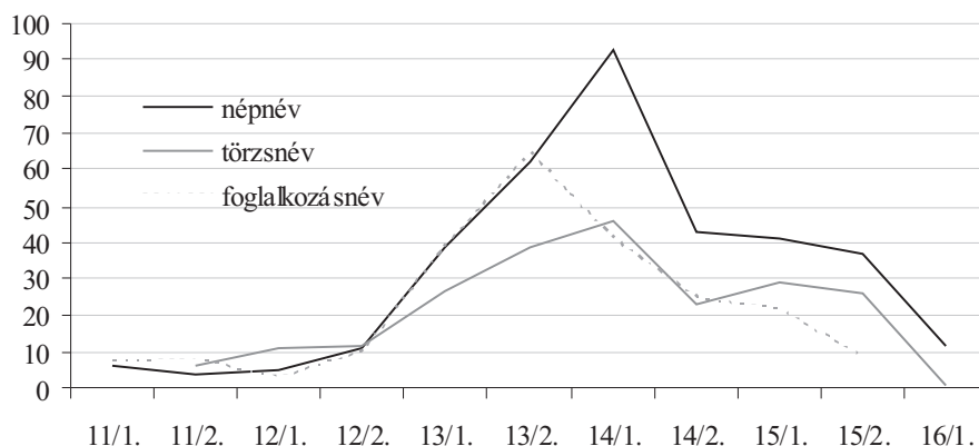
2. ábra A társadalmi csoportnevekből alakult formáns nélküli településnevek időbeli eloszlása 100

A relatív kronológia kérdésében ismét csak Rác Anita kutatásaira hagyatkozhatunk, aki a népnévi, a törzsnévi és a foglalkozásnevekből alakult formáns nélküli helynevek első előfordulásait az alábbi görbén ábrázolta. 99